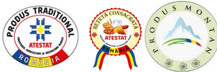
Figura 3 "Scheme de calitate națională"

Conform Registrului național al produselor tradiționale (RNPT), a Registrului Național al rețetelor consacrate (RNRC) și a Registrului național al produselor montane (RNPM) la nivelul lunii septembrie a anului 2019 erau certificate la nivel național: 701 produse tradiționale; 155 rețete consacrate și 170 produse montane. Numărul lor este încă redus, mult sub potențial datorită necunoașterii conceptului de produs certificat din partea majorității consumatorilor români.